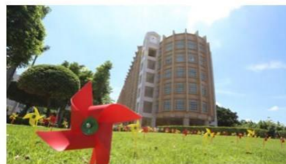
媒體報導-雜誌大學排行榜調查 國立勤益科大排名大躍進