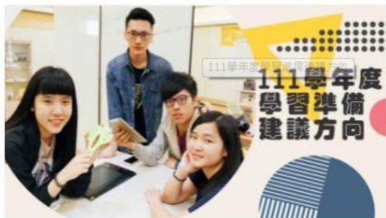
111學年度學習準備建議方向