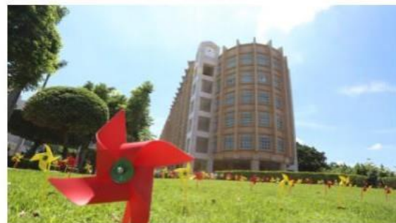
媒體報導-雜誌大學排行榜調查 國立勤益科大排名大躍進