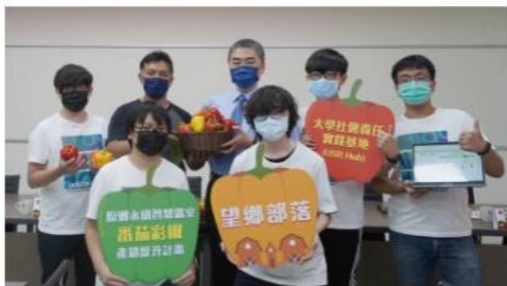
媒體報導-踴躍原民部落 勤益科大學生自組農業物聯網打造智慧溫室