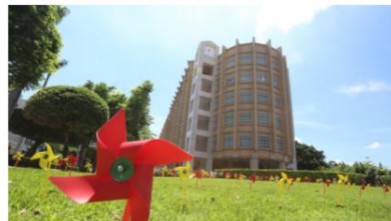
媒體報導-雜誌大學排行榜調查 國立勤益科大排名大躍進