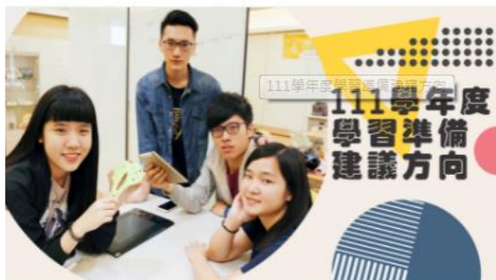
111學年度學習準備建議方向